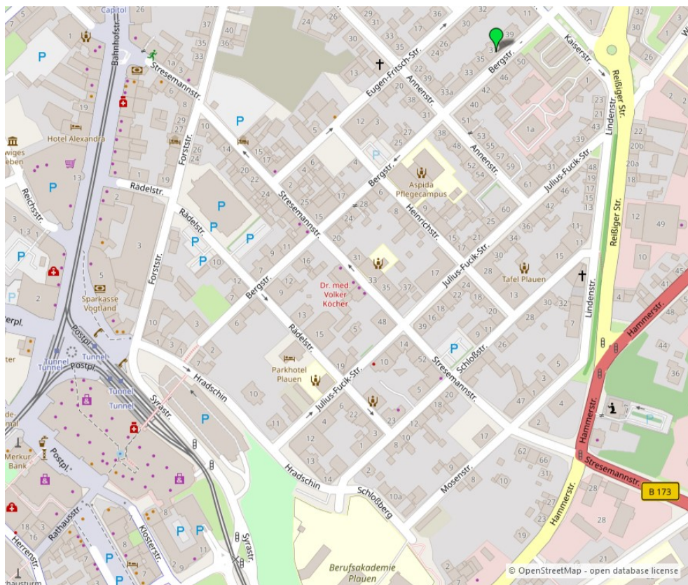
Umgebungskarte für „Bergstraße 37 in 08523 Plauen“