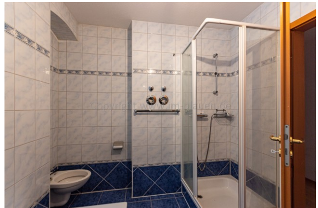
Bad Wanne u. Dusche