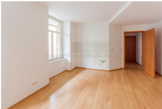
Wohnzimmer mit Küche