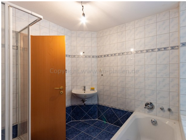
Bad Wanne u. Dusche