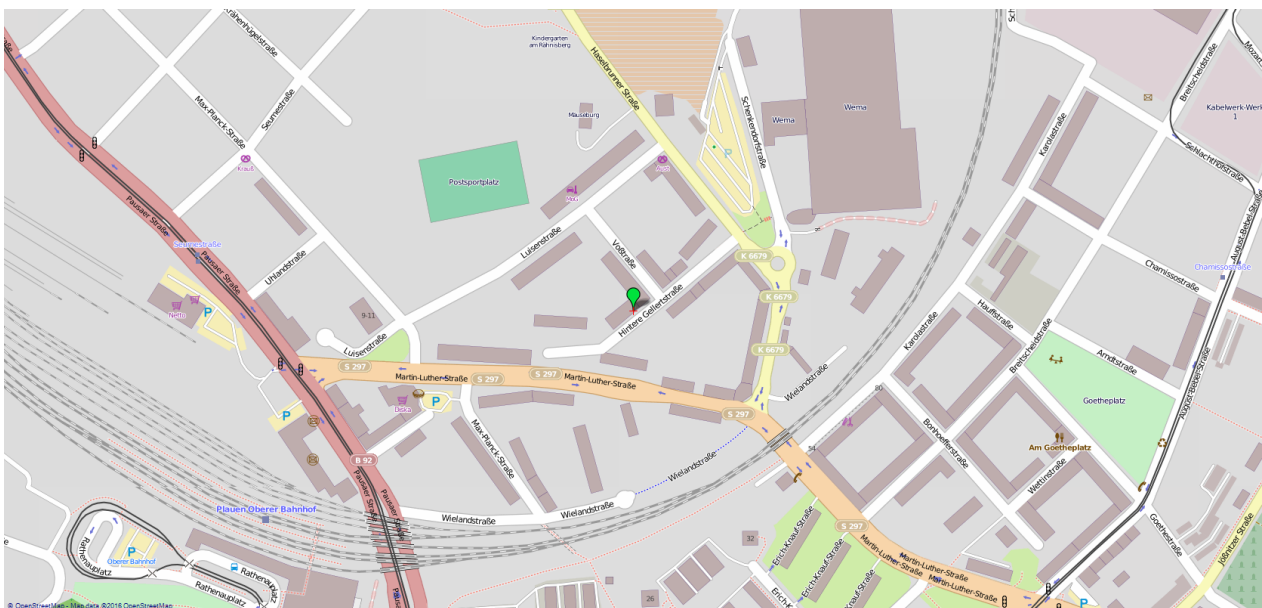
Umgebungskarte für „Hintere Gellertstraße 39 in 08525 Plauen“