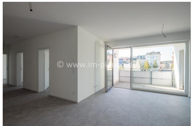
WZ mit Balkon