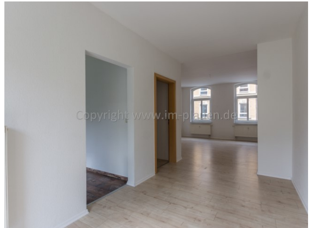
Essplatz am WZ