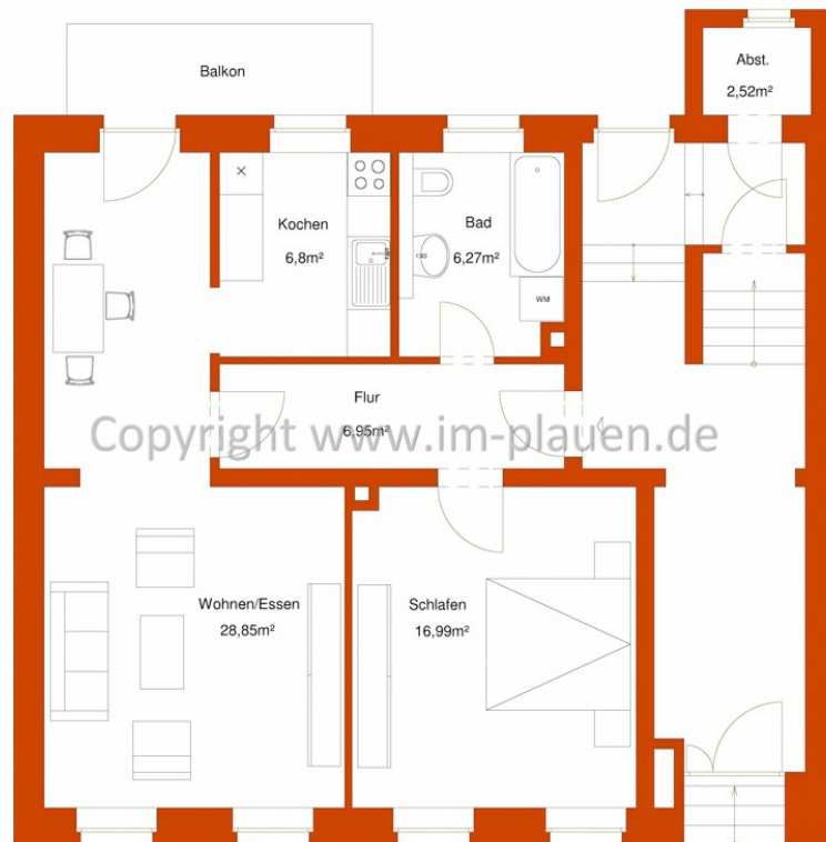
Grundriss - Herderstr. 9 EG links_