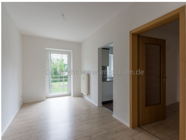
Essplatz am WZ