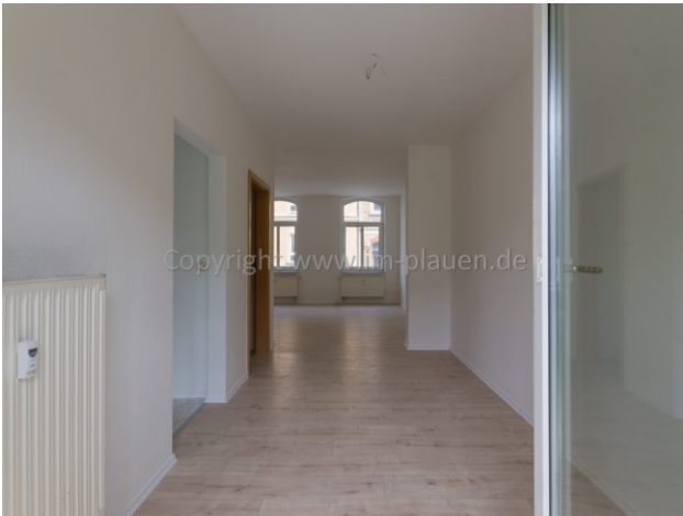
Essplatz am WZ