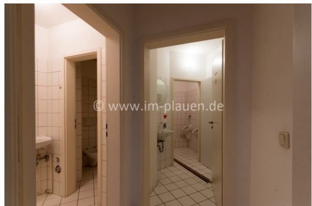
WC Damen und Herren