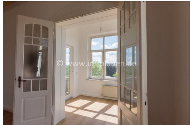
WG u. Balkon