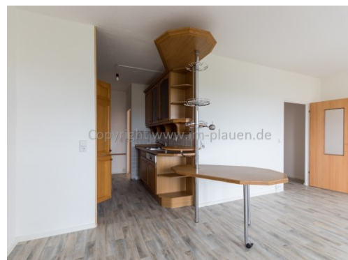
WZ mit offener Küche