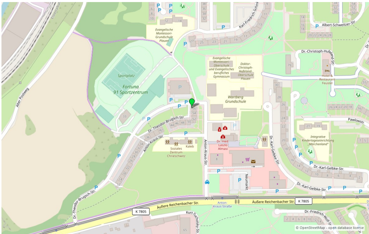
Umgebungskarte für „Dr.-Theodor-Brugsch-Straße 56 in 08529 Plauen“