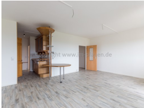
WZ mit offener Küche