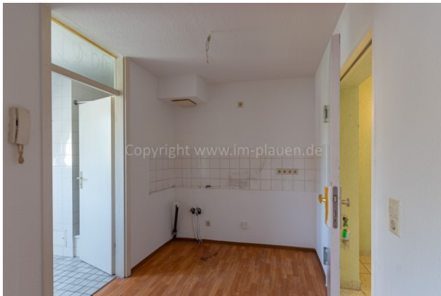
Flur mit Küche