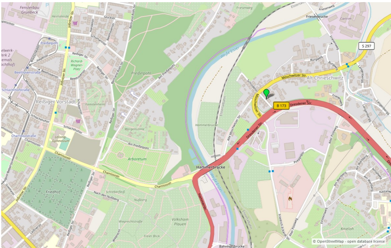
Umgebungskarte für „Schrödelstraße 17 in 08529 Plauen“