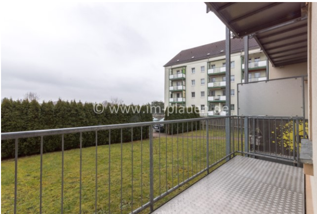
Balkon mit Ausblick