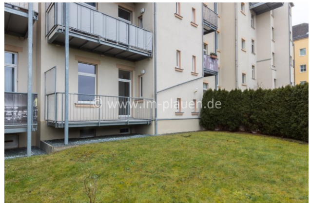
Hinterhof mit Balkon