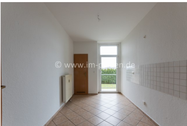
Küche mit AR + Balkon