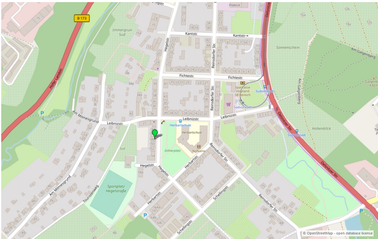
Umgebungskarte für „Hegelstraße 48 in 08527 Plauen“