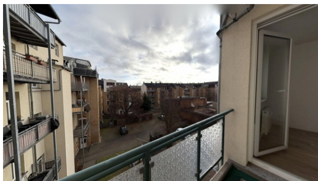
Balkon mit Ausblick