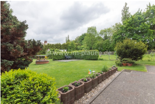
Hinterhof mit Garten