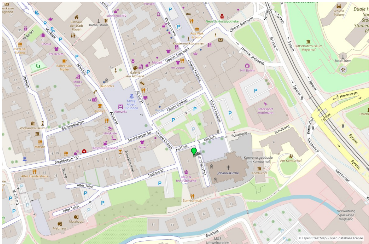
Umgebungskarte für „Johanniskirchplatz 2 in 08523 Plauen“