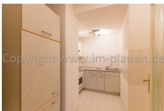
Küche mit EBK