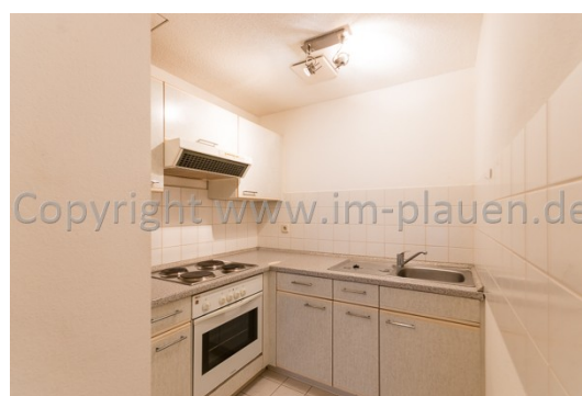
Küche mit EBK