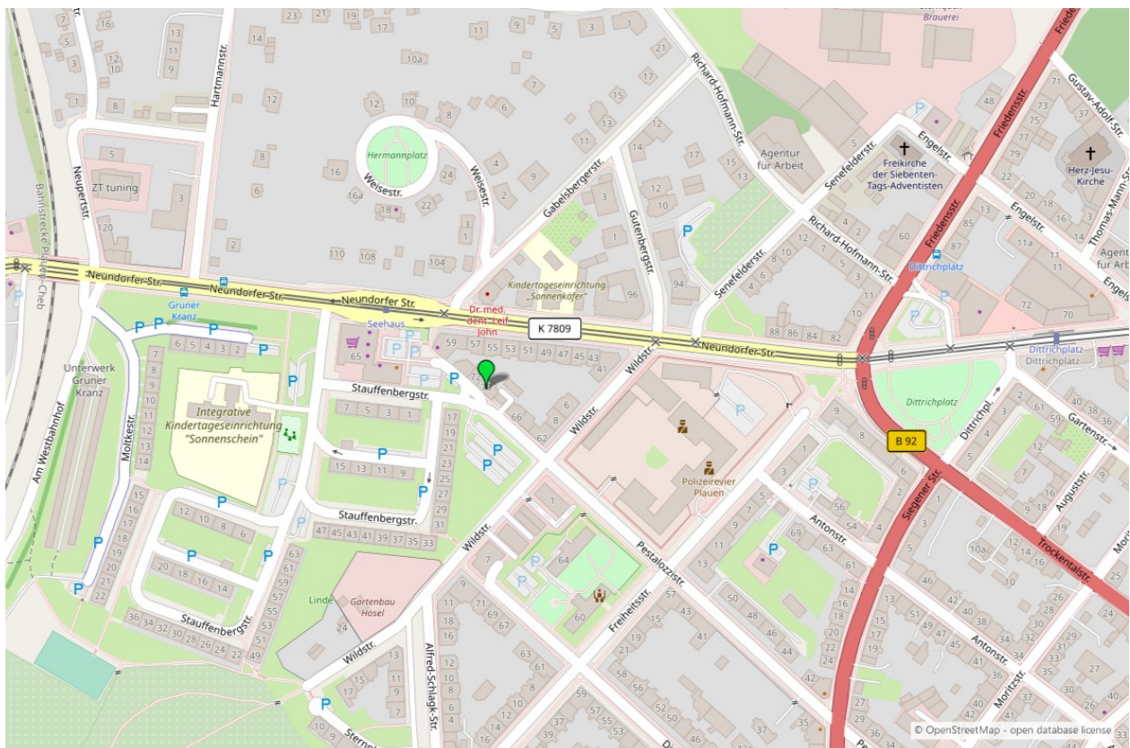
Umgebungskarte für „Pestalozzistraße 70-72 in 08523 Plauen“