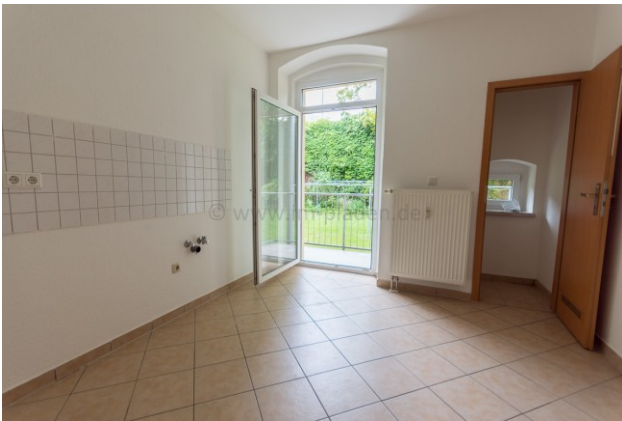
Küche mit Balkon