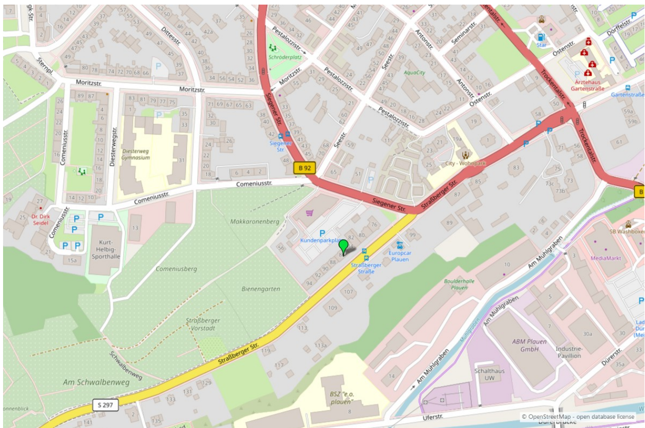
Umgebungskarte für „Straßberger Straße 86 in 08527 Plauen“