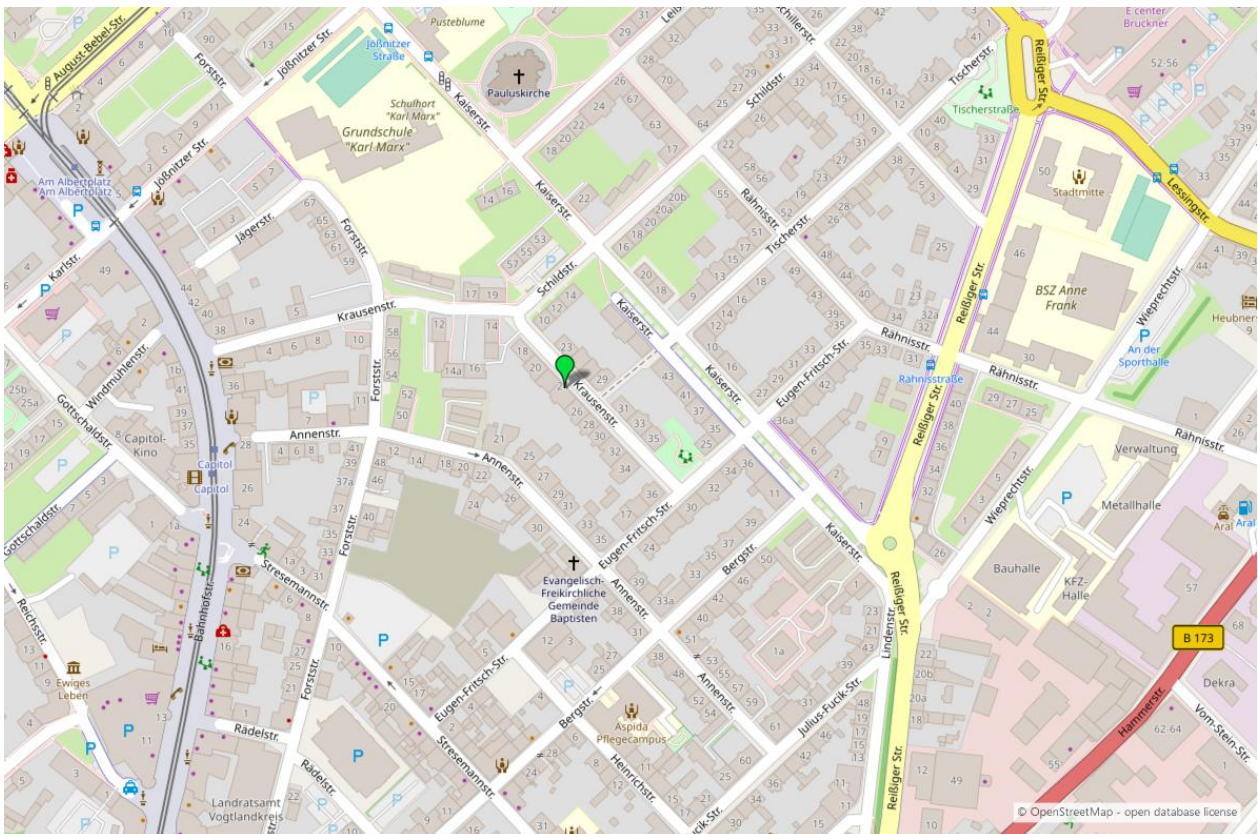
Umgebungskarte für „Krausenstraße 24 in 08523 Plauen“