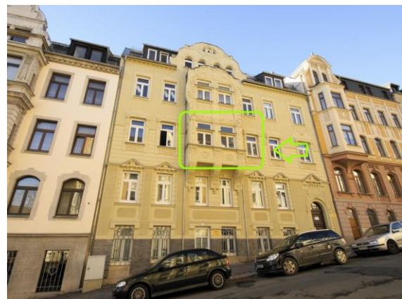
Lage im Objekt