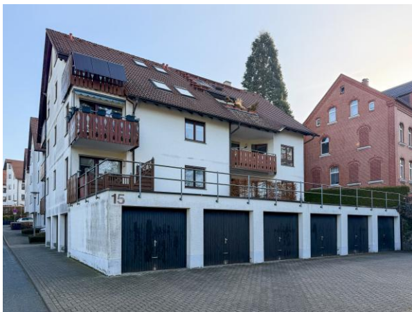
Hausansicht Viehmarkt 15 Lengelfeld