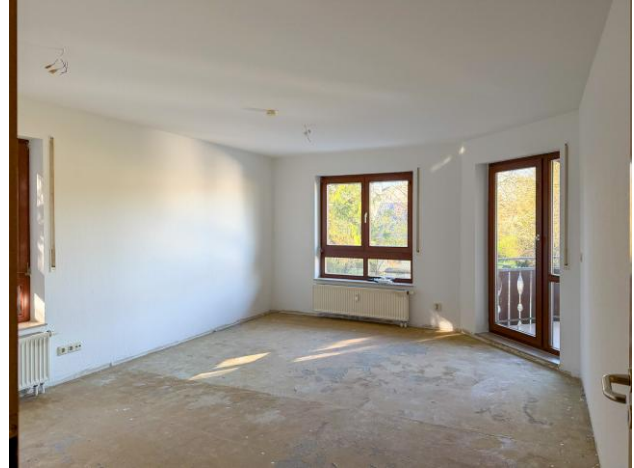
Wohnzimmer Viehmarkt 15