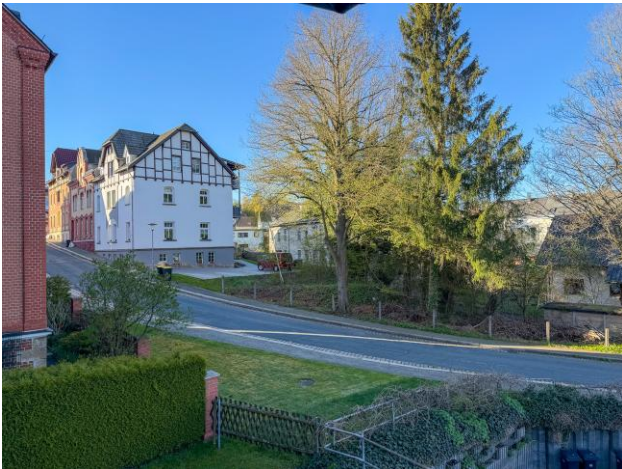
Außblick Viehmarkt 15