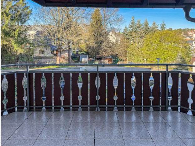
Balkon Viehmarkt 15