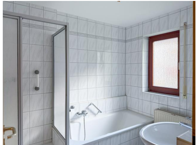
Badezimmer Viehmarkt 15