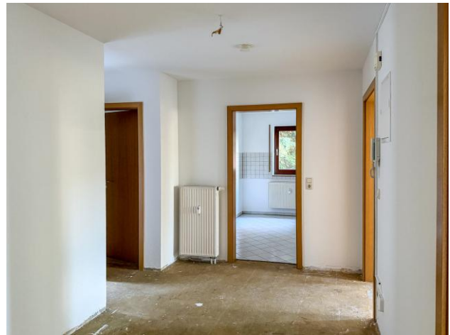
Flur Viehmarkt 15