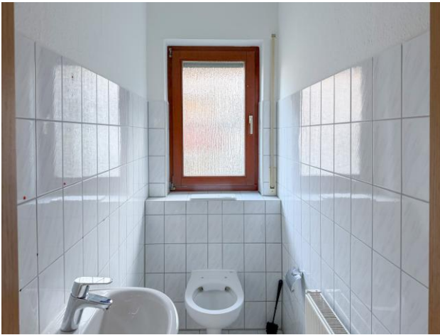
sep. WC Viehmarkt 15