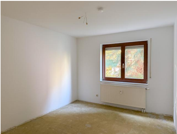
Kinderzimmer Viehmarkt 15