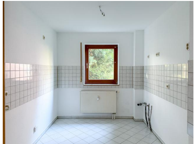
Küche Viehmarkt 15