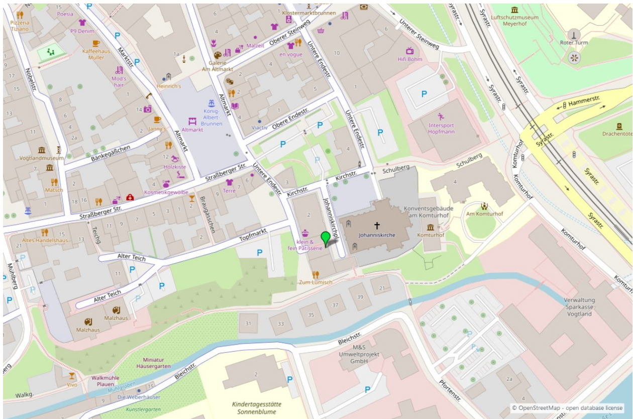
Umgebungskarte für „Johanniskirchplatz 4 in 08523 Plauen“