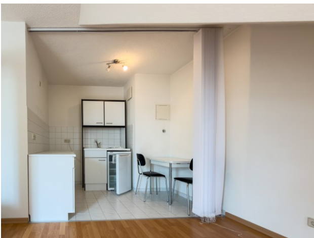
Küche mit Single EBK