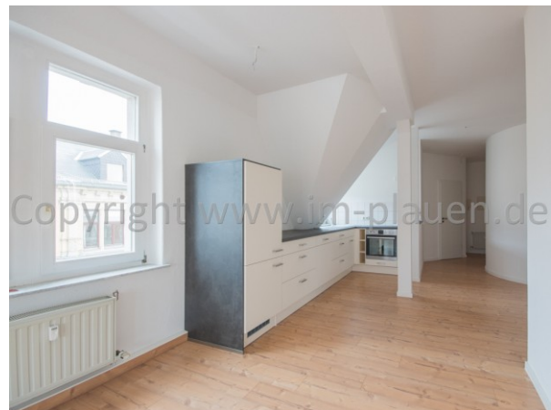
Blick in den Küchenbereich