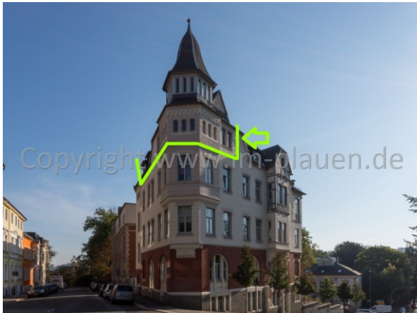
Lage im Objekt