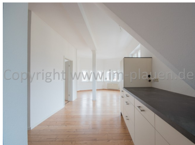
Blick in den Wohnbereich