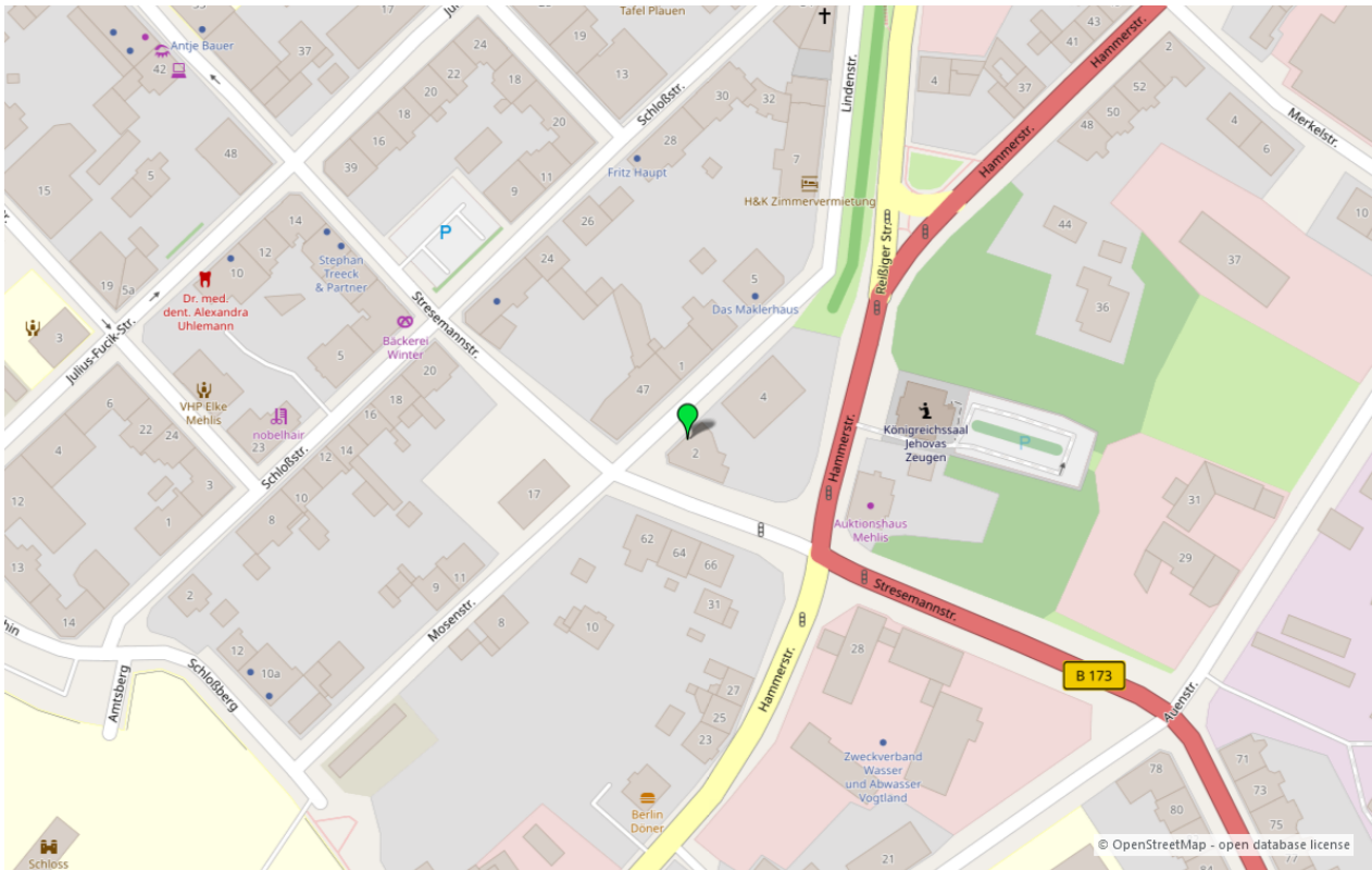
Umgebungskarte für „Lindenstraße 2 in 08523 Plauen“